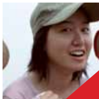
บับเบิ้ล