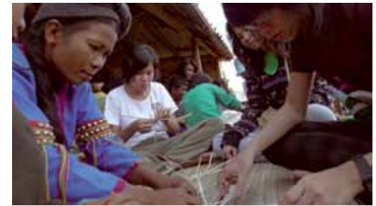
สานตะแกลว